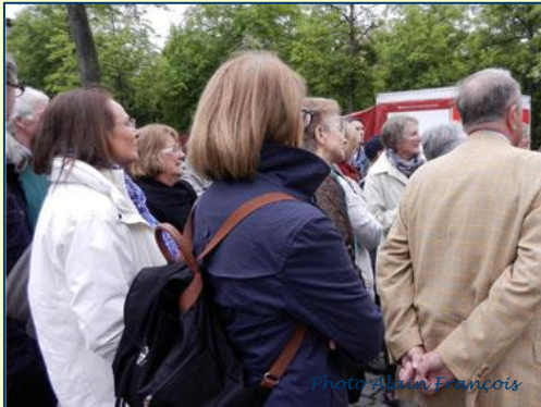
très attentifs lors de la visite de Münster

L'année universitaire 2013-2014, pour notre Commission des Relations Internationales, aura été riche en événements.