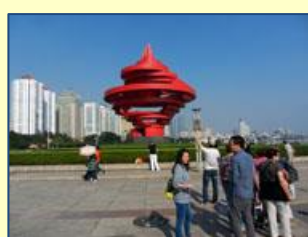
Sur la place du 4 mai