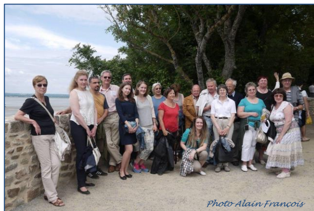
Sous le soleil, au Mont Saint-Michel

Nos amis russes nous ont quittés le mardi matin, après une semaine très ensoleillée, conviviale, comme à l'accoutumée, et, bien sûr, avec la promesse de nous retrouver en 2016, à St-Petersbourg . en espérant que, là-bas, la situation s'améliore.