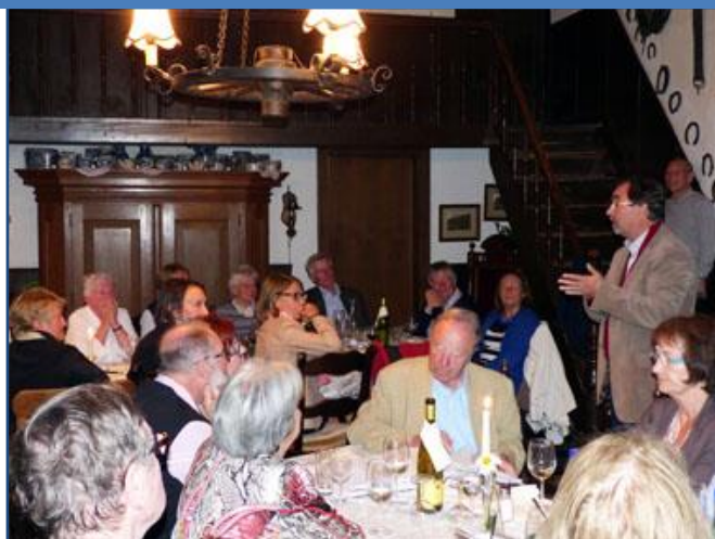
Ambiance autour de la table

Le mercredi fut une journée Dortmund avec la visite de la Mine de charbon de Zeche Zollern près de Dortmund, célèbre dans le monde entier, visite particulièrement passionnante du fait de son architecture qui lui a d'ailleurs valu le surnom de " château de travail ", de ses installations, mais aussi, tout au long de la visite, cette "mise en situation de mineur" pour nous-mêmes. En activité de 1898 à 1966, la mine fut sauvée de la démolition au dernier moment, en 1969, quand elle est devenue le Musée d'histoire sociale et des civilisations de l'industrie minière de la Rhur.