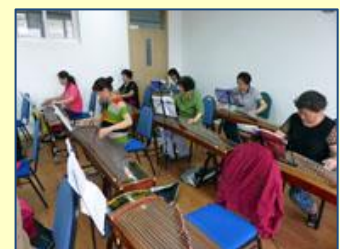
Un cours de guzheng