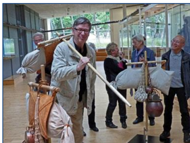
Un courageux fantassin!