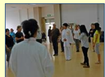
Au cours de taij