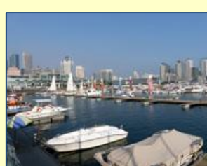
La Cité nautique