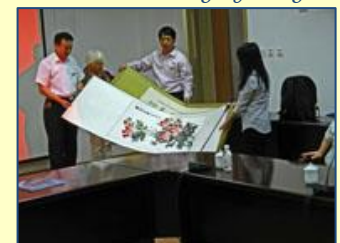
Echange des cadeaux