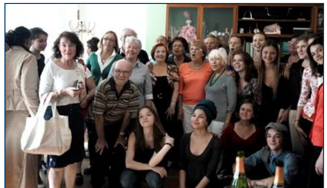
"On a débouché en riant à l'avance du champagne de France et l'on a chanté ..."