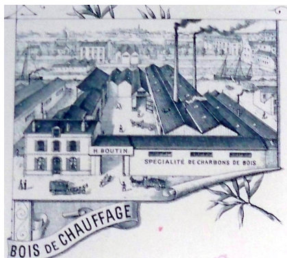
Entête de lettre Manufacture Boutin ADLA 7U 257 Pinel Boutin